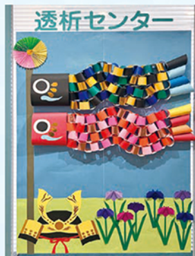
5月の壁面飾り(透析)

職員募集 ・医師 ・介護福祉士 ・MSW(社会福祉士)・調理師 お問合せはTEL0265(35)7511人事課まで