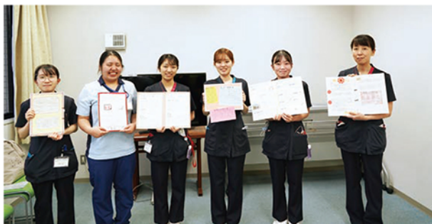
▲ 今年度の新人看護師・介護福祉士のポートフォリオ

の前で発表し、知識の共有をします。 研修は一年で修了しますが、その後も、定期的に見返すことで、自己評価やキャリアアップランニングに役立てます。