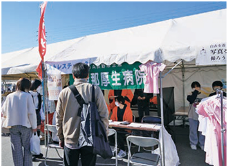
▲ 当院のブースでは、『ストレスチェック』と『白衣を着て写真を撮ろう!』を行いました