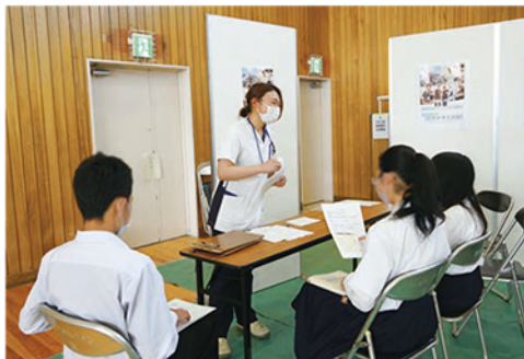
▲言語聴覚士による話と実際に治療等で使用しているテストの体験