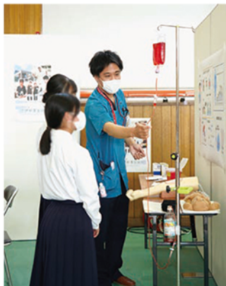
▶看護師による点滴の仕組みの話と医療器具の紹介や体験