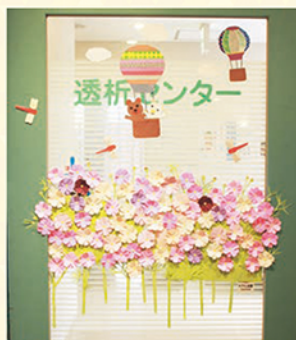
10月の壁面飾り(透析)