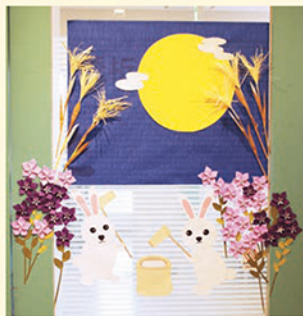
9月の壁面飾り(透折)