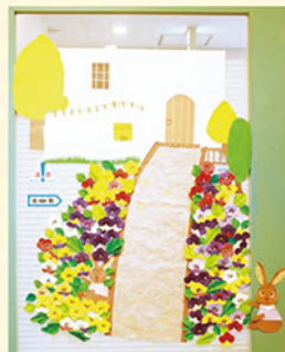
5月の壁面飾り(透折)