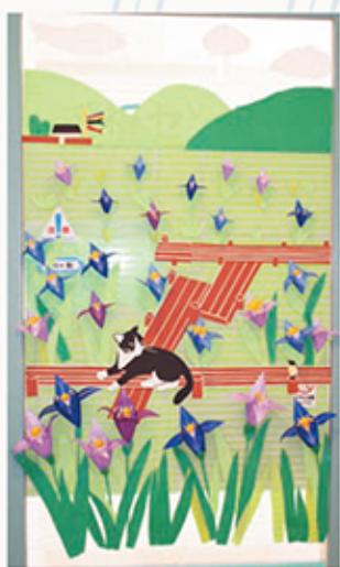
5月の壁面飾り (透折)

職員募集 ・医師 ・言語聴覚士 ・薬剤師 お問い合わせはTEL0265(35)7511人事課まで