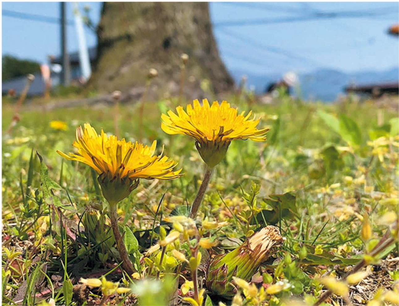
(写真) シナノタンポポ (高森町下市田 時の駅)

(病院理念) 私たちは、地域の皆さんと共に、生活に密着した保健・医療・福祉を通じ、安心と満足の達成を目指します JA長野厚生連 下伊那厚生病院 ホームページ http://www.shimoina-hp.jp Facebook https://www.facebook.com/shimoinakousei/