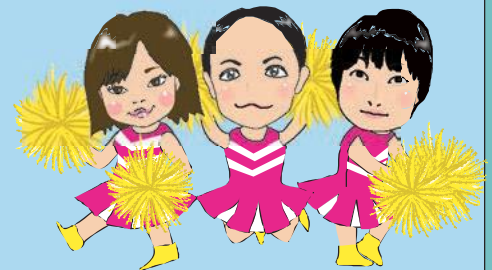
健診センター 健康生活応援隊