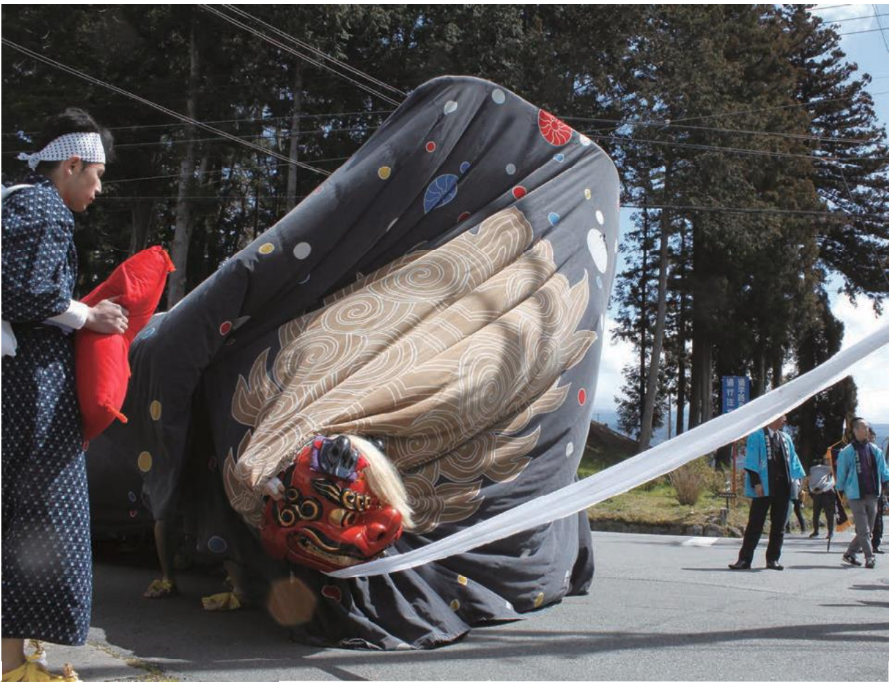
(写真) 麻績神社の春祭り (飯田市座光寺)

(病院理念) 私たちは、地域の皆さんと共に、生活に密着した保健・医療・福祉を通じ、安心と満足の達成を目指します J A長野厚生連 下伊那厚生病院 ホームページ http://www.shimoina-hp.jp Facebook https://www.facebook.com/shimoinakousei/