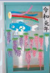
5月の壁面飾り (透析)