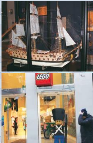
バイキングの船模型