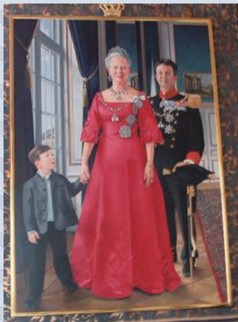
▲デンマーク女王陛下 マルグレーテ2世

ウェーデンが分離し、17世紀の「三十年戦争」頃から衰退し始めました。1864年の「デンマーク戦争」で、ユトランド半島南部のシュレスヴィヒとホルシュタインを失います。その後のデンマークは「外で失ったところを内に取り戻そう」というかけ声の下、国内の未開拓地の開拓運動を開始して、それに成功します。独自の酪農を主体とした農業中心の小国として現在に至ります。