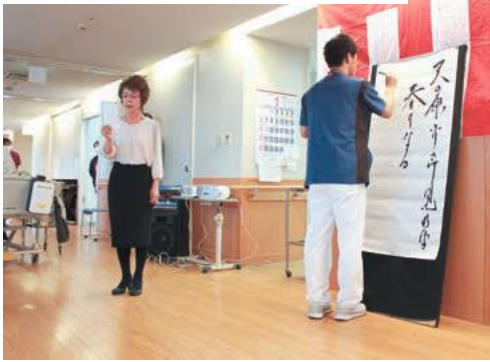
▶詩吟と書道の書道吟