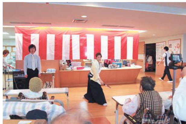
▼詩吟と舞の詩舞 (しぶ)