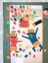
2月の壁面飾り (透析)