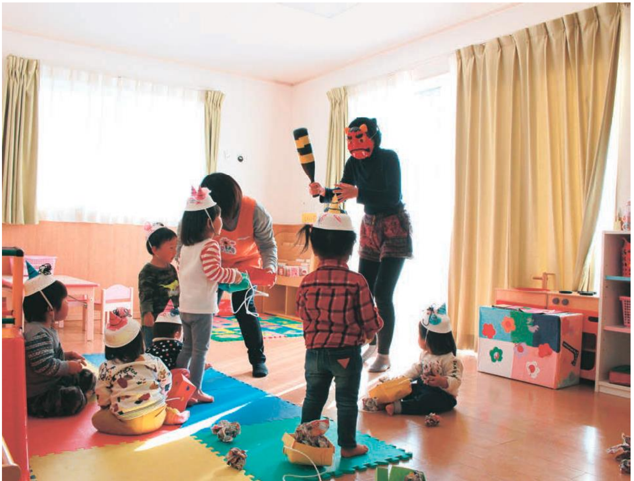
(写真) 節分の豆まき (院内保育所いちだっこ)

(病院理念) 私たちは、地域の皆さんと共に、生活に密着した保健・医療・福祉を通じ、安心と満足の達成を目指します。 JA長野厚生連 下伊那厚生病院 ホームページ http://www.shimoina-hp.jp Facebook https://www.facebook.com/shimoinakousei/